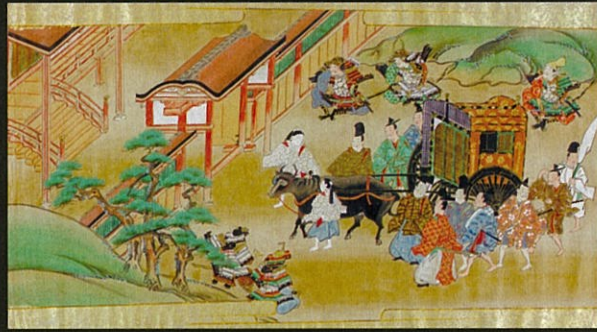
國學院大學図書館蔵（部分）